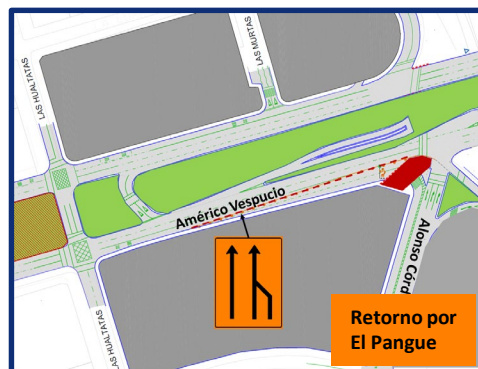
Etapa 2: 18 y 19 de mayo