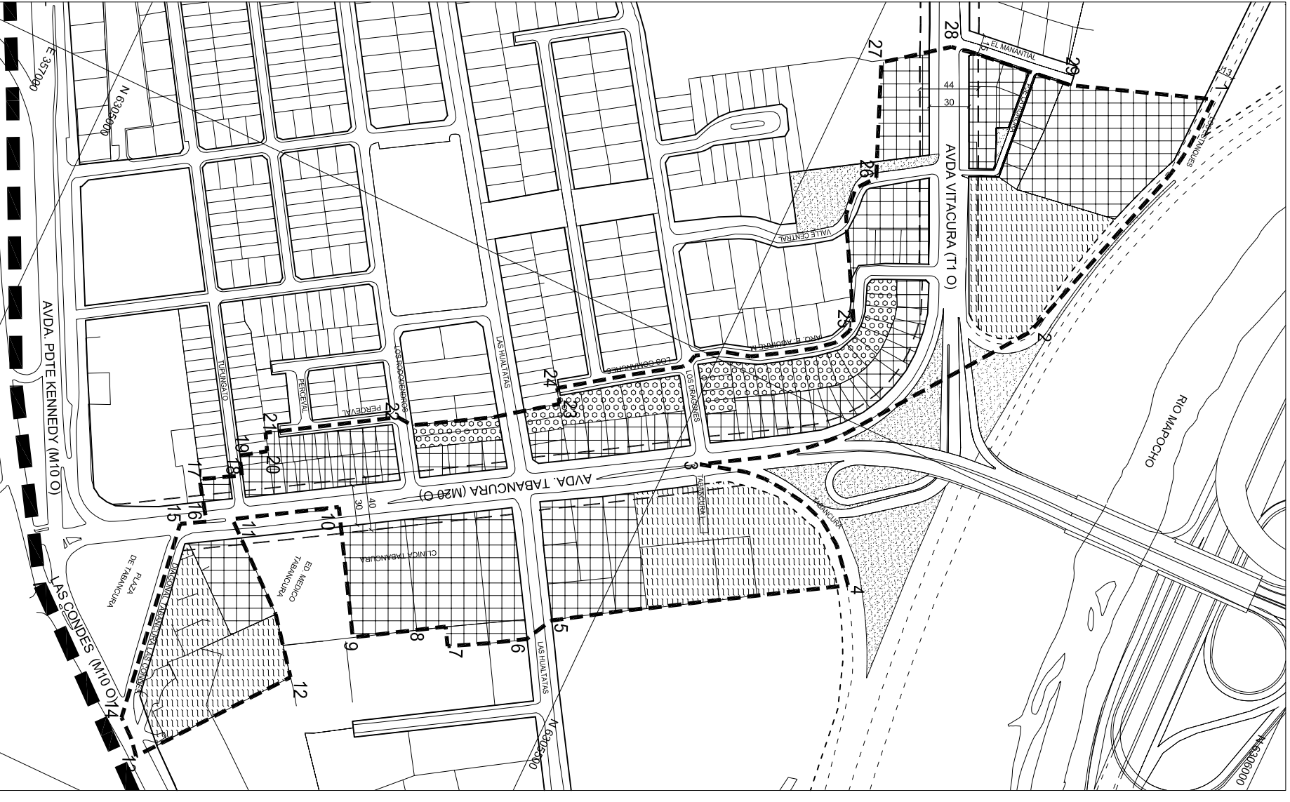
SITUACION QUE SE APRUEBA POLIGONO 1-2-3-4-5-6-7-8-9-10-11-12-13-14-15-16-17-18-19-20-21-22-23-24-25-26-27-28-29-1