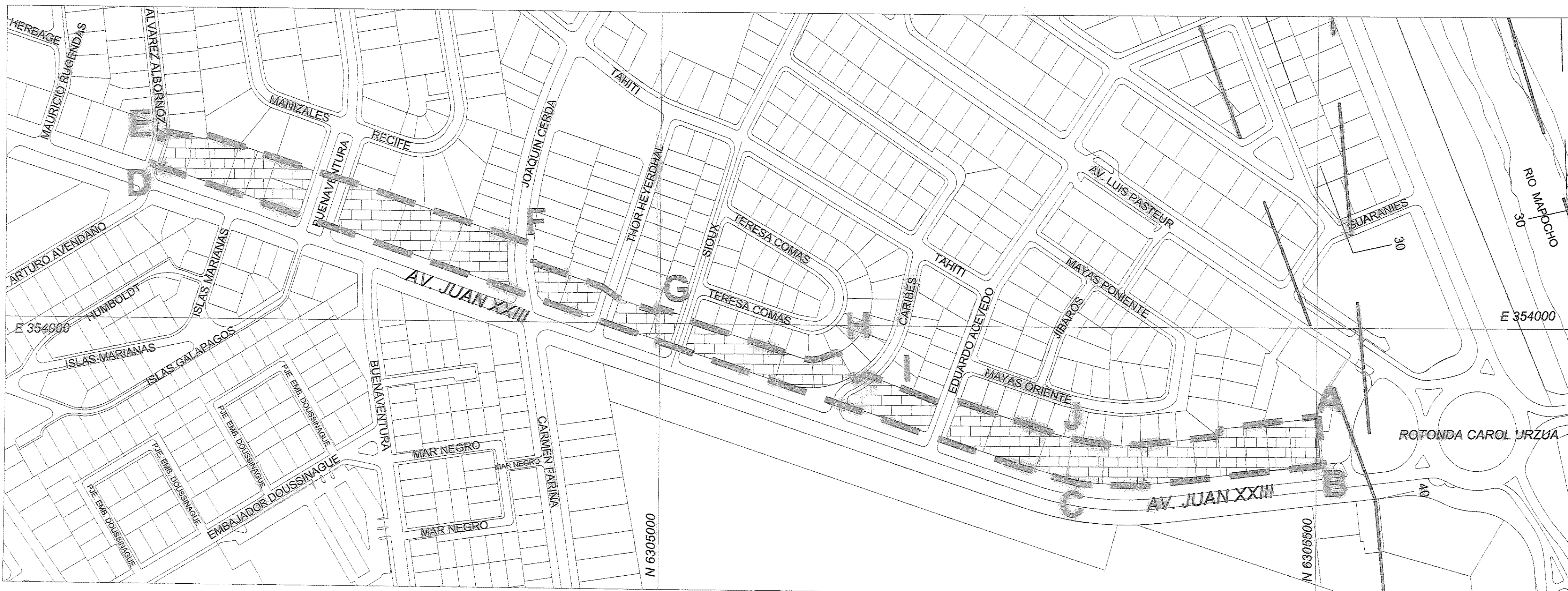
Lámina Nº 018 16 08 2010