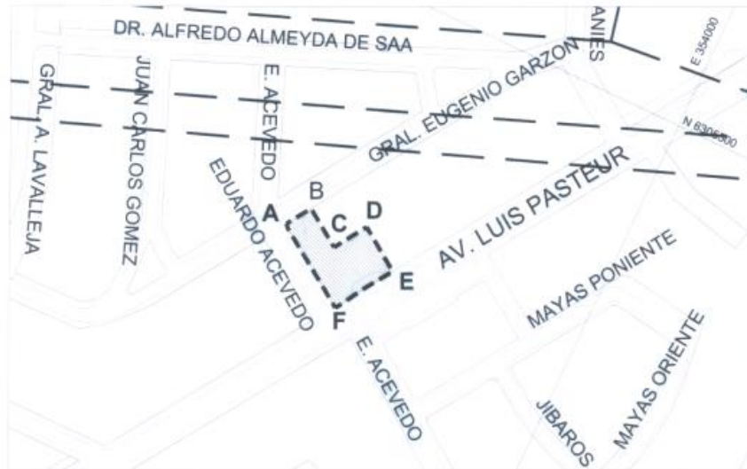
Lámina N° 20 05 05 2011

SITUACION QUE SE APRUEBA POLIGONO A-B-C-D-E-F-A